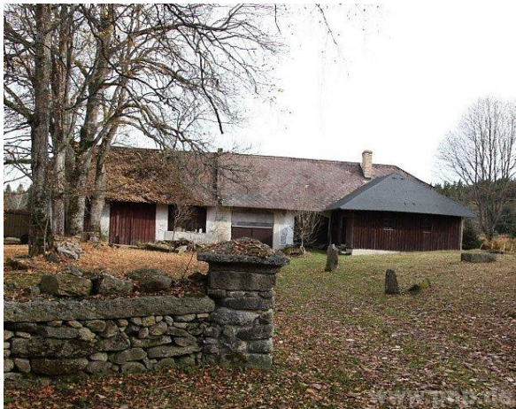
Das Wirtschaftsgebäude des alten Forsthauses wurde als einziges Haus verschont.